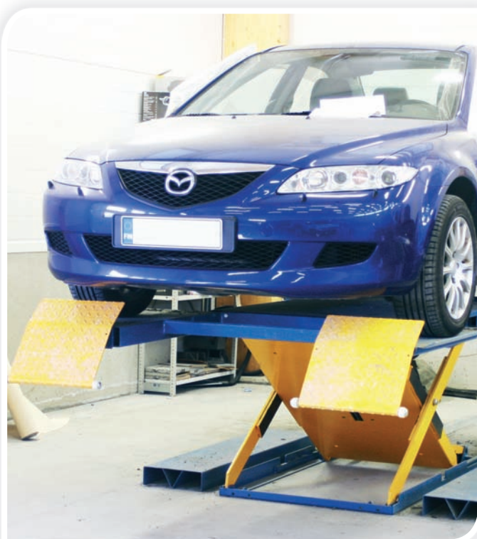
Kammion 2 Herkules nosturin lisäksi maalaamon puolelle hankittiin 4 muuta Herkules maalaamonostinta.