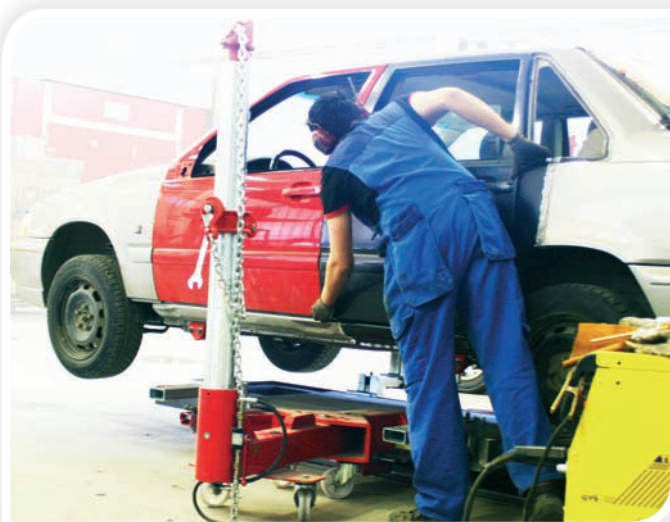
Peltiseppä Simo Murto työskentelmässä COIRON minipenkin kanssa.