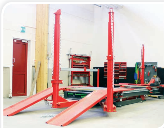
Simon työvälineisiin kuuluu myös COIRON LB6000 yleisjigipenkki.