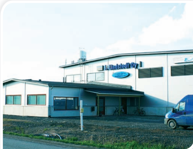
Automaalaamo J. Lindstedt ja Elovainion Autohuolto.