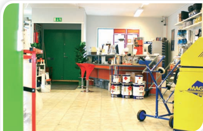
Kuvat yllä: Kuvia Ykkösvärin toimitiloista.